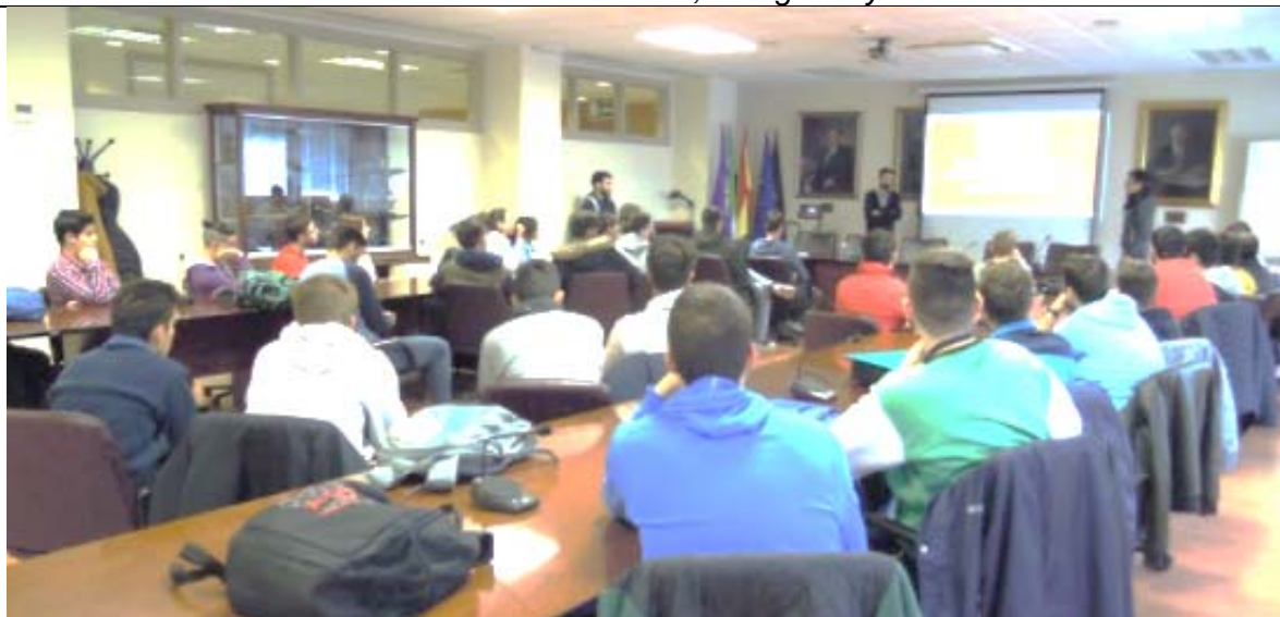
Foto del taller de movilidad