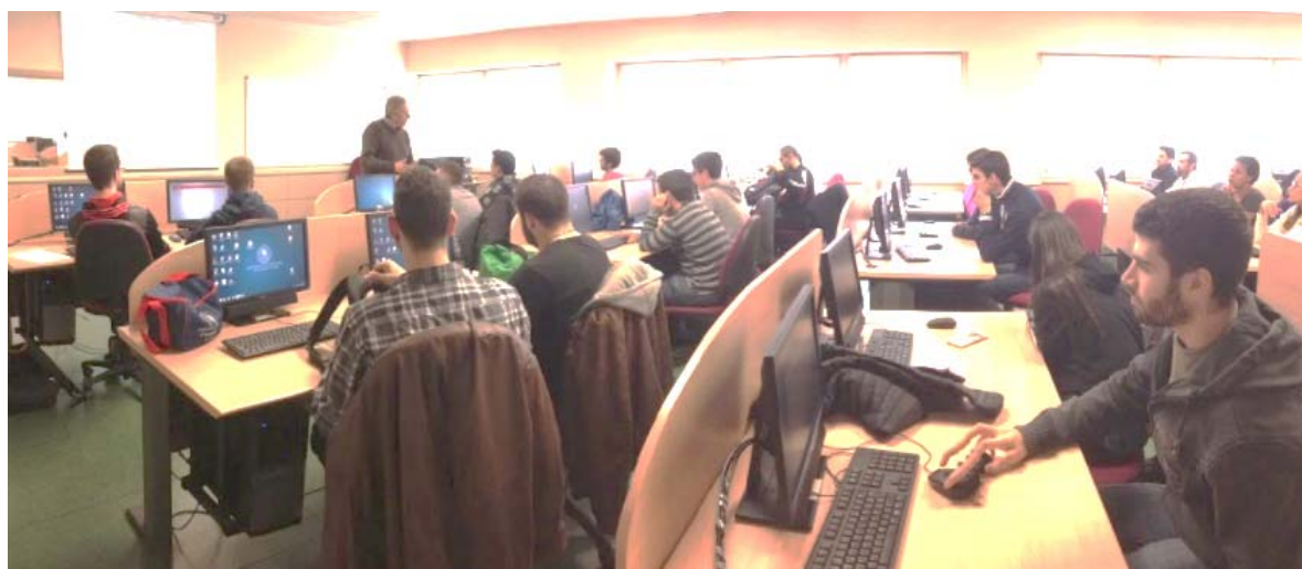
Foto de los talleres de iniciación de la plataforma ilias y del taller de edición de documentos