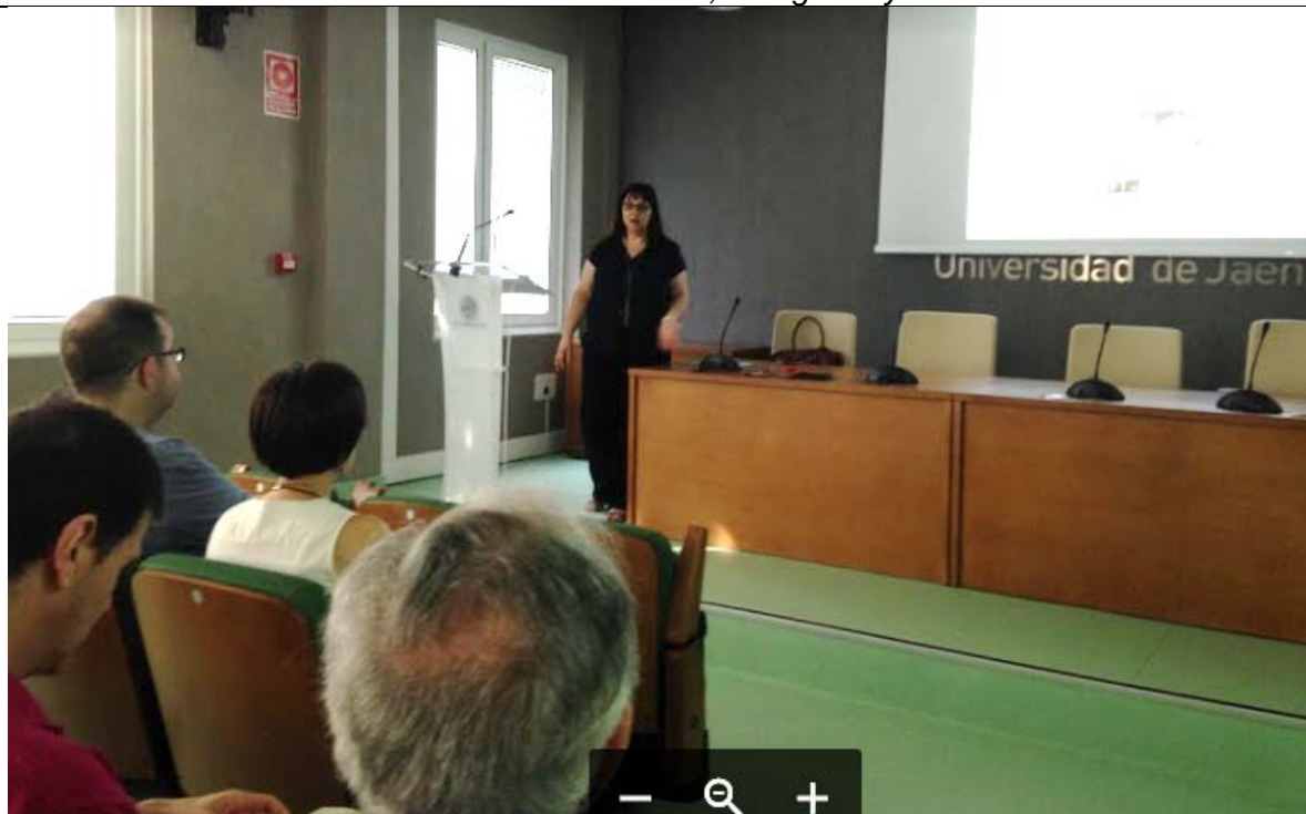
Foto del encuentro final con tutores