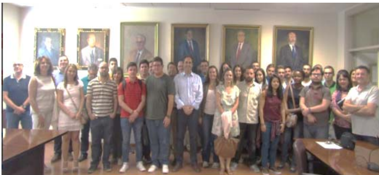
Foto del taller de alumnos y tutores