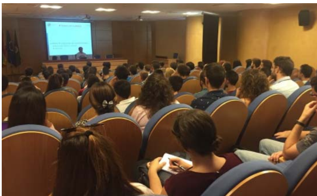
Foto del Taller de cómo seleccionar el Trabajo Fin de Grado