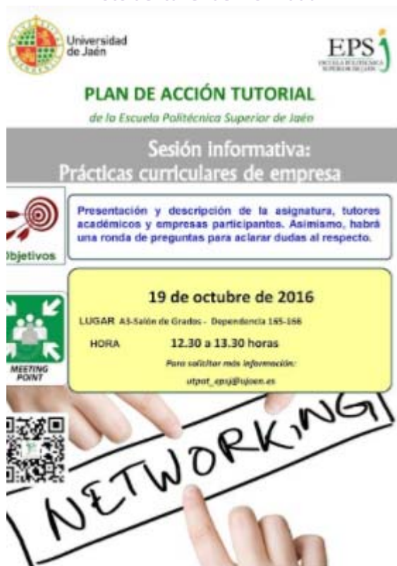
Cartel que anuncia el taller de prácticas curriculares y de empresa